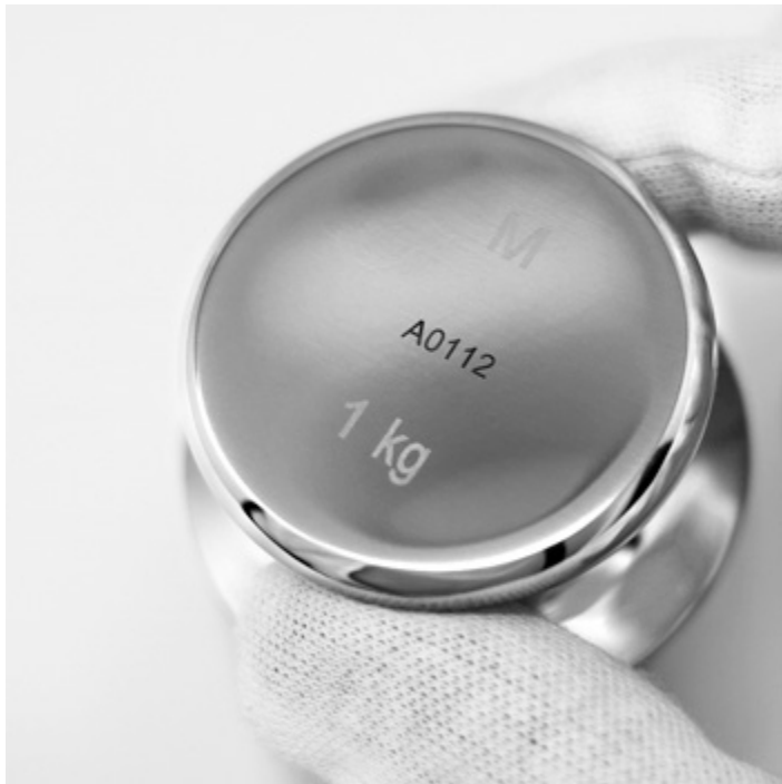
Esempio di marcatura laser opzionale