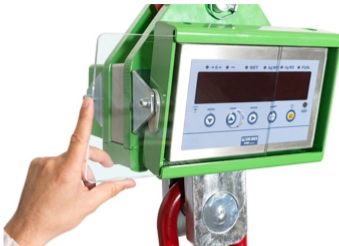
Schermo protettivo in plexiglas per display e tastiera