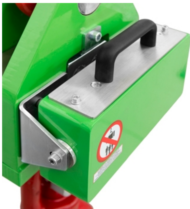
Pacco batteria ricaricabile estraibile di serie