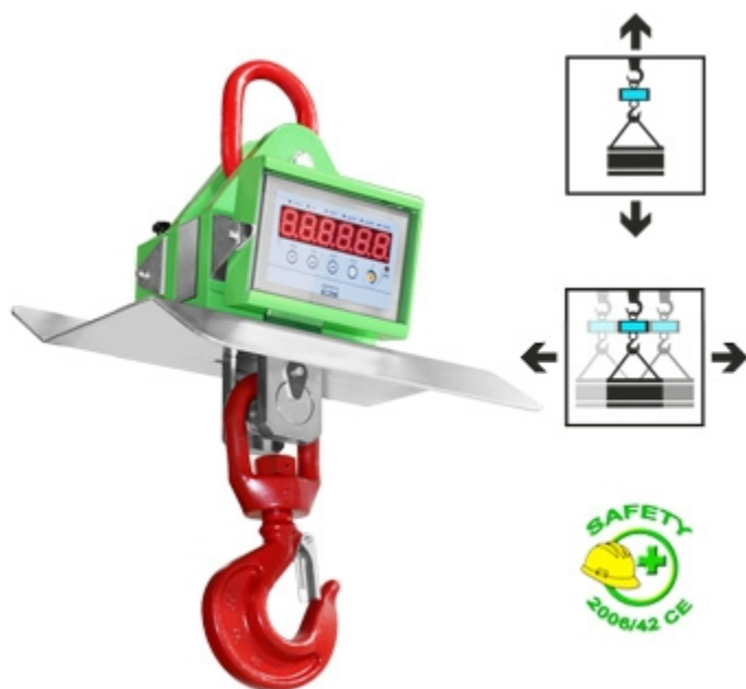
Dinamometri con campanella, gancio girevole e scudo termico opzionali