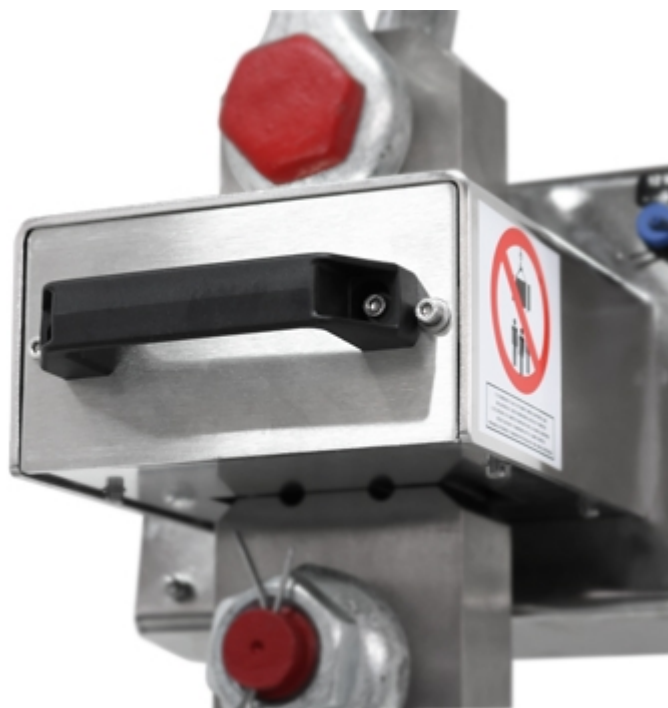
Dinamometro MCW09: dettaglio della batteria estraibile