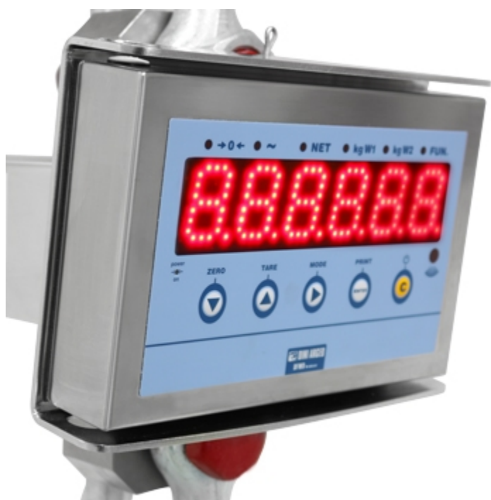
Dinamometro MCW09: display super-luminoso da 40mm